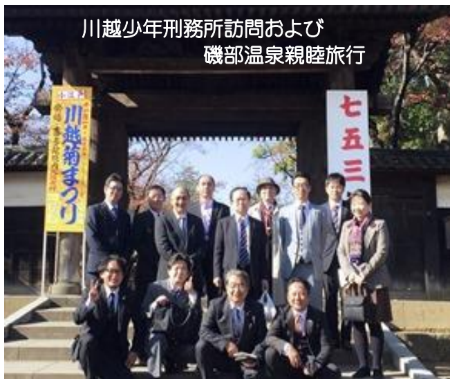
川越少年刑務所訪問および 磯部温泉親睦旅行