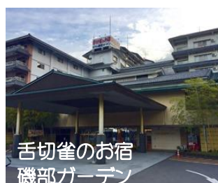
舌切雀のお宿 磯部ガーデン