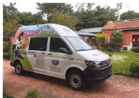
台湾の農村部へ医療巡回車寄贈 (岩槻RC) 医療施設の少ない台湾東部の農村部に超音波検査と心電図検査機器を備えた医療巡回車を寄贈した。これにより、遠隔地に住み、移動が困難な人にも質の高い医療サービスを提供できるようになり、早期の治療や疾病予防が期待される。グローバル補助金を利用し、姉妹クラブである桃園経国RCを含め、日本・台湾・韓国の7クラブ共同での支援で実現した。 12月18日 第2770地区 埼玉県