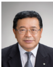
ガバナー 松本 輝夫