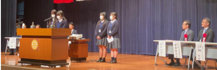
姉妹クラブ 桃園経国扶輪社