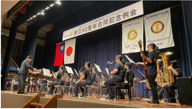
オープニング（岩槻高等学校吹奏楽部）