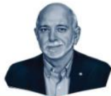
ロータリー財団管理委員長からのメッセージ ロータリーとは何か

1971年にオノ・ヨーコと一緒にリリースした「ハッピー・クリスマス（戦争は終わった）」の中で、ジョン・レノンは、「So this is Christmas/and what have you done?（これがクリスマス。君は何をしたの?）」と歌いました。クリスマスから年末年始は、思いやりと団らんの時期であり、1年を振り返る時でもあります。そして恵まれない人々に対して寛大な心を示す時です。この時期に行うロータリー財団への寄付は、単にプレゼントの意味だけでなく、年間を通じた支援につながります。