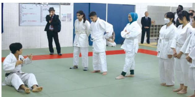
(ロータリーの友2月号8pより 柔道を体験するガザの子どもたち)

ガザに住む3人の中学生を迎えた交流会では「ガザの 声を聞く」ということで、日々命の危機にさらされている こと、「天井のない刑務所」と言われているようにガザ地区 から自由に外出できないこと、電気は1日6時間しか使え ないこと、人権を与えられることを望んでいること等世界 に向けて発表してくれたそうです。